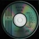
0000 THE DVD COLLECTION 100